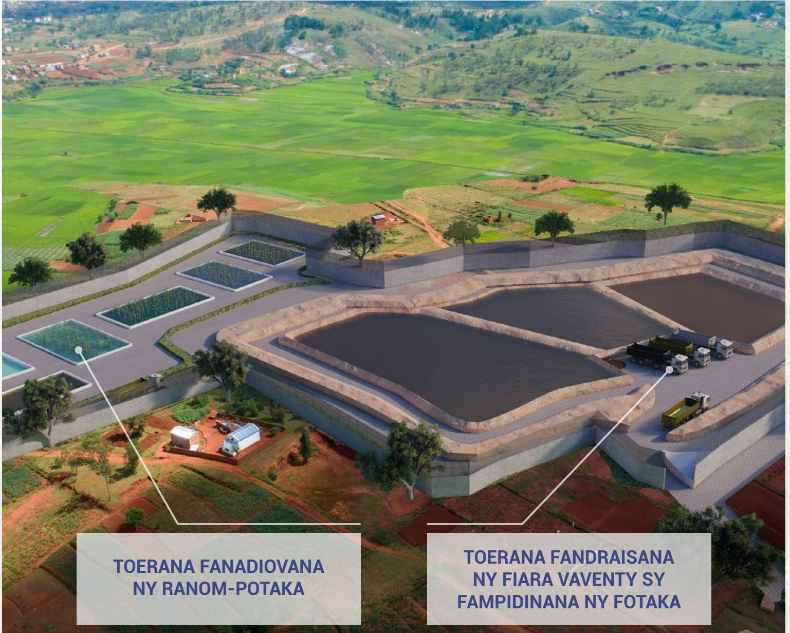
TOERANA FANADIOVANA NY RANOM-POTAKA